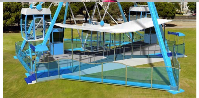
Посадочная платформа колеса обозрения