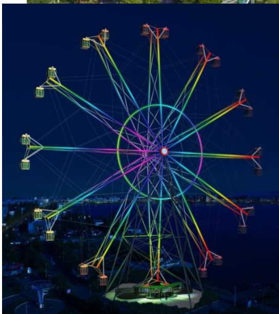
Ночной вид колеса обозрения